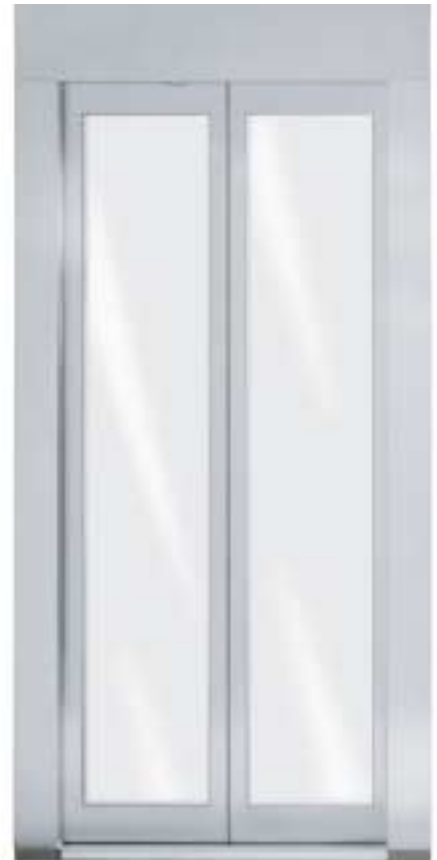
Glasrahmentüren Doors with framed-glass panels