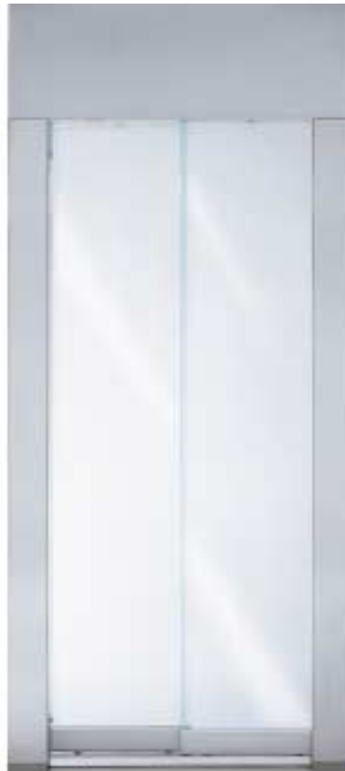
Vollglastüren Doors with full glass panels

All executions comply with the EN 81.1/2 norms